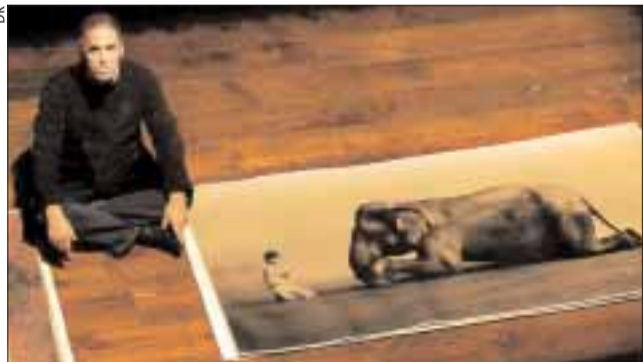
GREGORY COLBERT (en haut, et son musée éphémère (en bas))

Depuis 14 ans, cet artiste canadien photographie les animaux qui peuplent l'imaginaire populaire : éléphants, baleines, aigles,..."Je travaille à redécouvrir le territoire commun qui existait lorsque les êtres humains vivaient en harmonie avec les animaux," explique-t-il. "Il faut arriver à réconcilier l'homme et la nature. Il y a trop de fondamentalistes dans le monde. Nous sommes trop divisés". La